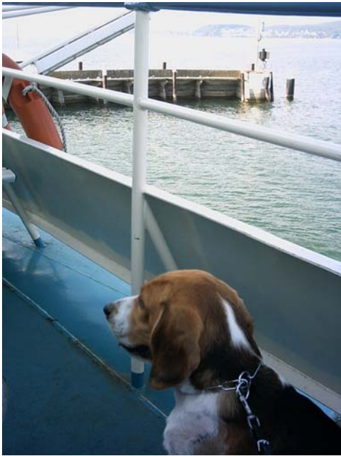
Eine Schiffsreise (Fähre nach Meersburg), eine Modenschau mit Simone und Katharina,