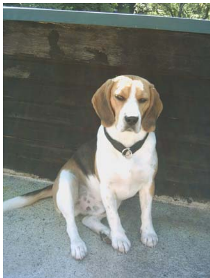
Wenn doch nur immer Urlaub wäre.....