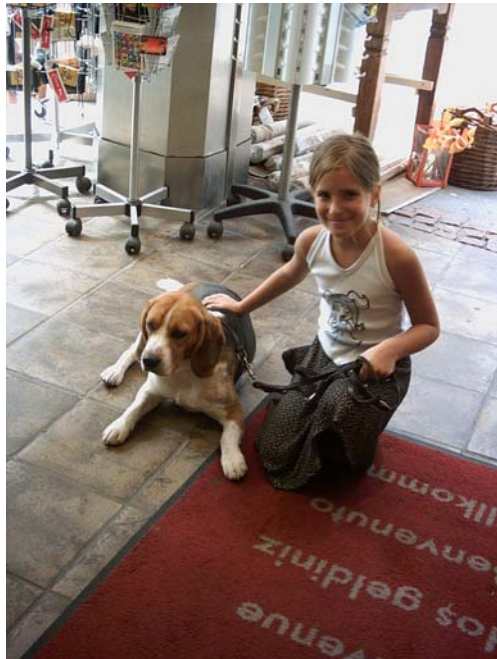
Einkaufsbummel in der Stadt und einen Ausflug ans Ende des Regenbogens